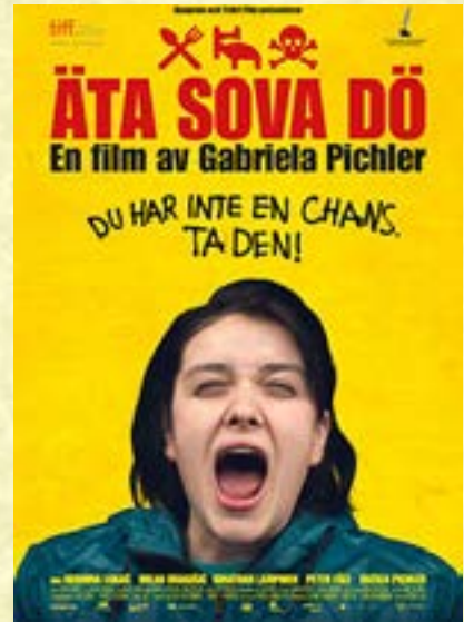
Manği, dormi, morti, de Gabriela' Pilčero p. 33