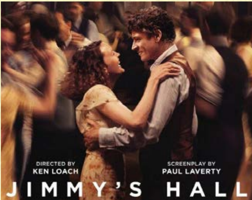
Halo de Gímio, de Ken' Louč' p. 33