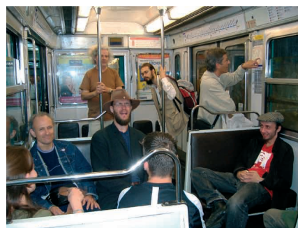
En pariza metroo