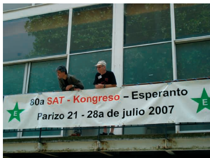
La kongresejo ekstere