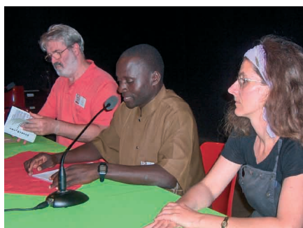
Prelego de k-do Mramba Simba