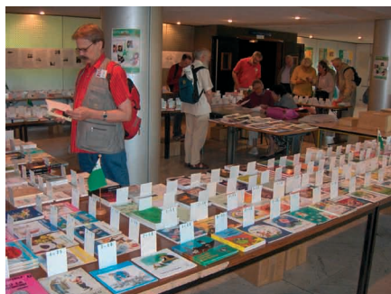
Belega libroservo de SAT-Amikaro