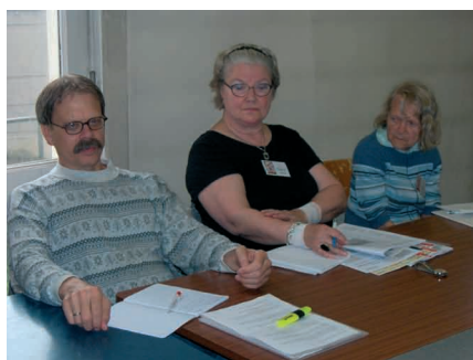
Dum laboro en komisionoj