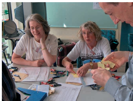
Akcepto de kongresanoj