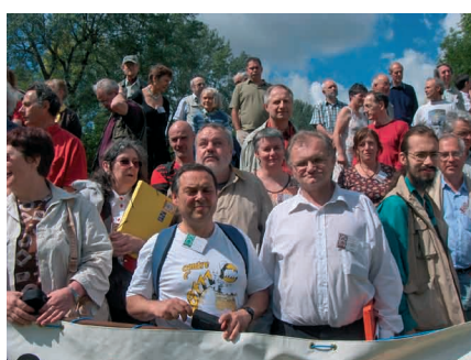
Detalo de la maldekstra foto