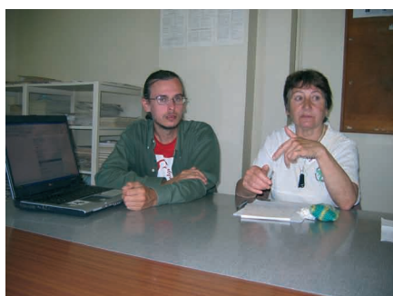
Frederiko klarigas pri SAT-TTT