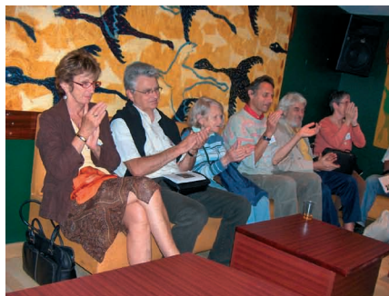
Dum interkonatiĝa vespero