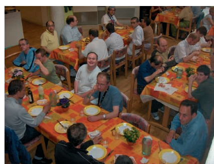
Vizito al hejmo de handikapuloj