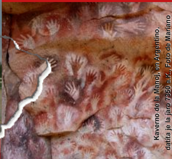
Kaverno de la Manoj, en Argentino, datita je la jaro 7350 a.K.

SAT-anoj kutimiĝu al eksternacia sent-, pens- kaj agadkapablo!