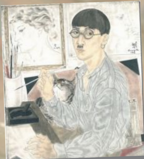
■ Latinameriko kaj Hujxita, p.5