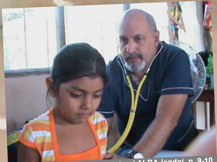
■ Kubo kaj gxiaj rilatoj kun ceteraj ALBA-landoj, p. 9-10