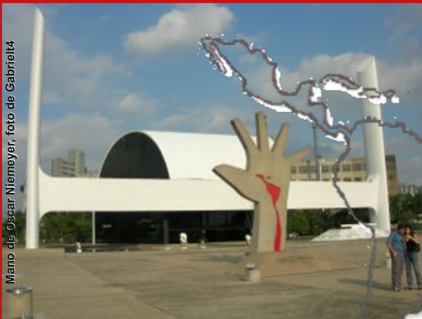
Mano de Oscar Niemeyer