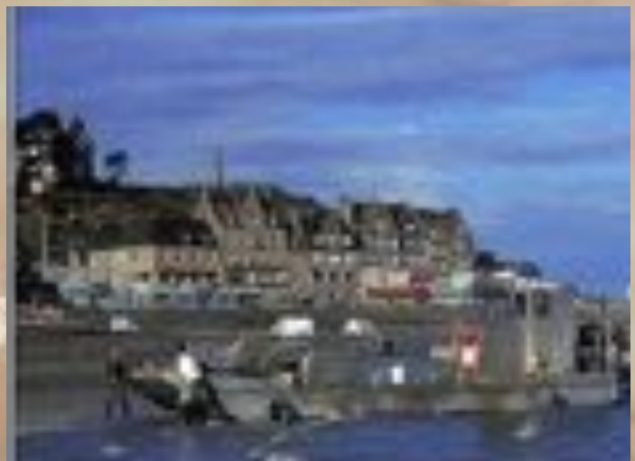
■ Pri Kankal' kaj aliaj ekskursolokoj dum la dinana SAT-Kongreso, p.