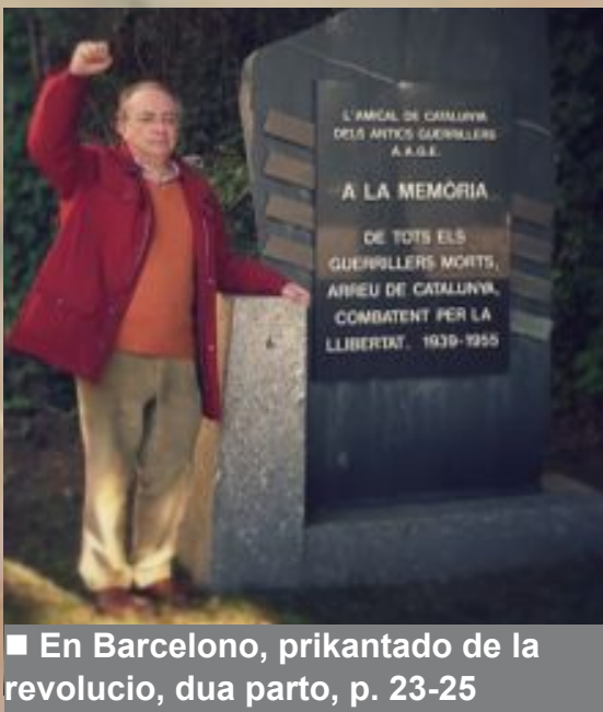
■ En Barcelono, prikantado de la revolucio, dua parto, p. 23-25