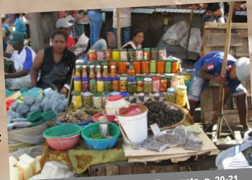
■ Du semajnoj en Malagasio per Esperanto, p. 20-21