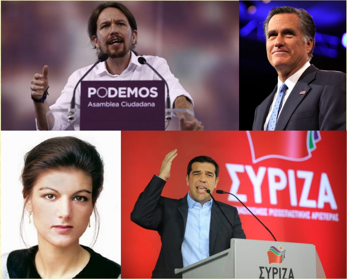
Temdosiero “Novaj situacioj ĉe politikaj partioj”