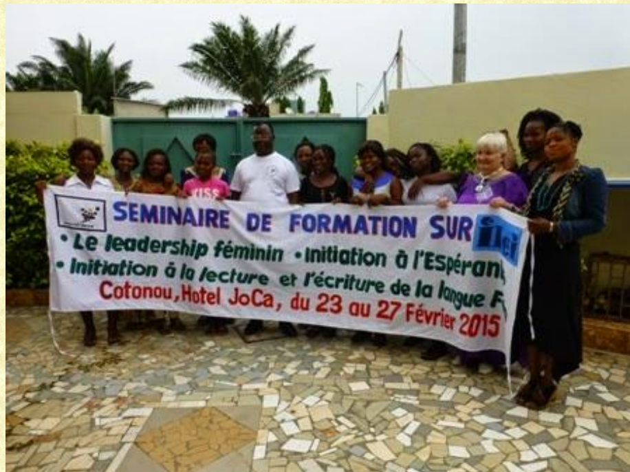
Seminario por Virinoj - SEVI, p. 27