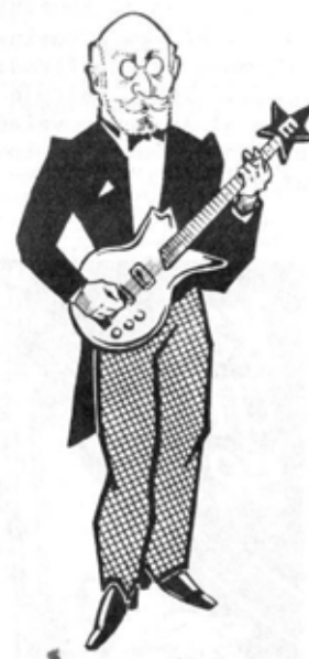
Zamenhof rokemus far Niko Voloŝin

[30] Bildfilmeto de Robin Guinin pri la rezulto de EDE ĉe la Eŭropaj balotoj de majo 2019: https://www.facebook.com/LE.ROBINOSCOPE/videos/vb.590860637591928/376895542921635/?type=2&theater