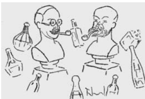
Desegno de R. Laval: Kies kapo tie apud tiu de Ŝvarc? Ĉu ne pipumanta Zaza

ĉe: https://www.huffingtonpost.fr/2015/01/07/cabu-goerges-wolinski-mort-charlie-hebdo-attaque-terroriste_n_6428912.html