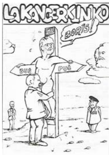
Presdesegno de Serĝo Sir' kun Buŝ, Gorbaĉev kaj Jelcin okaze de l' Aŭgusta puĉo (1991)