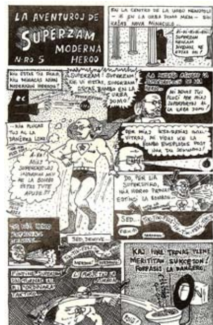
Bildrakonto kun SuperZam, de Ian Carter