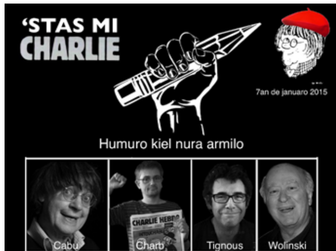
Bildo longe aplaŭdata dum la koncerto de La Kompanoj por la 100a UK de UEA en Lillo la 27an de julio 2015.

Ann Telnaes raportas: «Mi memoras, mi sidis antaŭ mia komputilo, kaj mi rigardis mian Tviteran mesaĝaron, kiu furore sinsekvis kiel valoroj sur ekrano de monmaŝino, kaj elverŝas hatajn mesaĝojn. Tiam ĉar temis pri nova fenomeno, mi nenion respondis, mi restis silenta sur la sociaj retoj. Sed hodiaŭ mi alimaniere vidas la aferon. Kiam mi ricevas minacon, sub formo de tvitpepoj aŭ retmesaĝoj, mi tuj publikigas ĝin.»