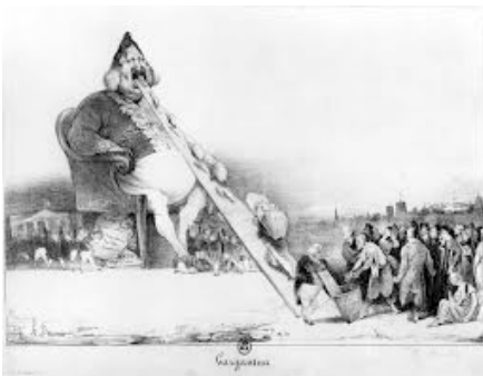
Honore Daumier: Gargantueca reĝo voranta la impostojn

la reĝon Ludoviko-Filipo sub la trajtoj de Gargantuo [2], voranta impostojn.