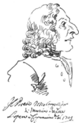
Karikaturo de Antonio Vivaldi far Pier Leone Ghezzi

Tamen, temante pri imperiestro aŭ reĝo, indas respektigi ilian aŭtoritatecon. Plimultiĝas la malpermesoj direkte al la desegnistoj. Kaj kelkaj el ĉi-lastaj pagis pro sia insolenteco. Ekzemple Daumier (Domje'). Konsiderata kiel unu el la plej vervaj karikaturistoj de sia epoko, li estis arestita kaj kondamnita je sesmonata arestado en malliberejo pro sia publikigo, la 16an de decembro 1831 en la gazeto La Caricature , de desegno montranta